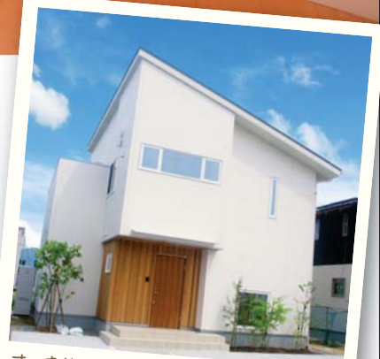
すっきり ミニマル 明るい外観

販売価格 (土地+建物) 2,980万円 敷地面積: 203.73㎡(61.63坪) 建物面積: 112.61㎡(34.05坪)