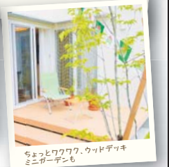
ちょっとワクワク、ウッドデッキ ミニガーデンも